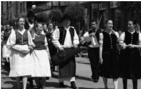
O dobrú náladu sa postaral spevácky zbor folklórneho súboru Zobor.

V rámci Nitrianskych univerzitných dní prešiel centrom Nitry pestrofarebný sprievod s alegorickými vozmi. Organizátori mu dali názov Karneval v Riu po slovensky, ale aj keď v ňom chýbali skutočné tanečnice s farebnými pštosími perím, nahradili ich úsmevy dievčienec z folklórneho súboru Zobor, tanečných súborov ALL FOR ONE a EIJA z CVČ Domino, ako aj mažoretiek I.NIMA. Do tanca a na dobrú náladu vyhrávala džezová skupina SWING LESS z UKF Nitra