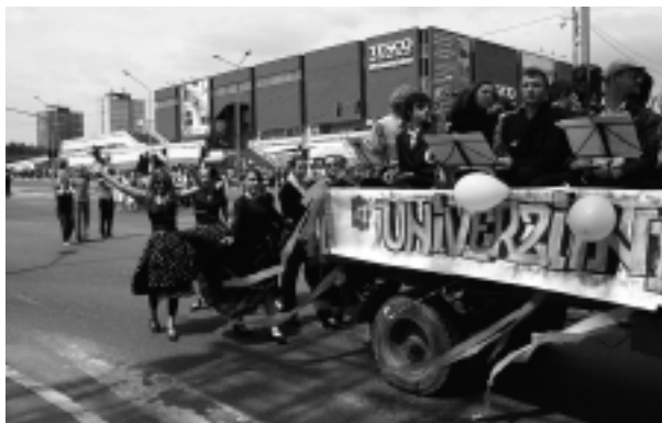
Súčasťou sprievodu boli pestrofarebné alegorické vozy.