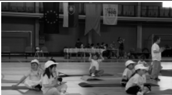
Na palubovke mestskej haly si spoločne zatancovali deti z piatich materských škôl z Nitry a Kroměříža.

Kroměřížsky a nitriansky dorast prišiel do športovej haly podporiť aj zástupca primá-