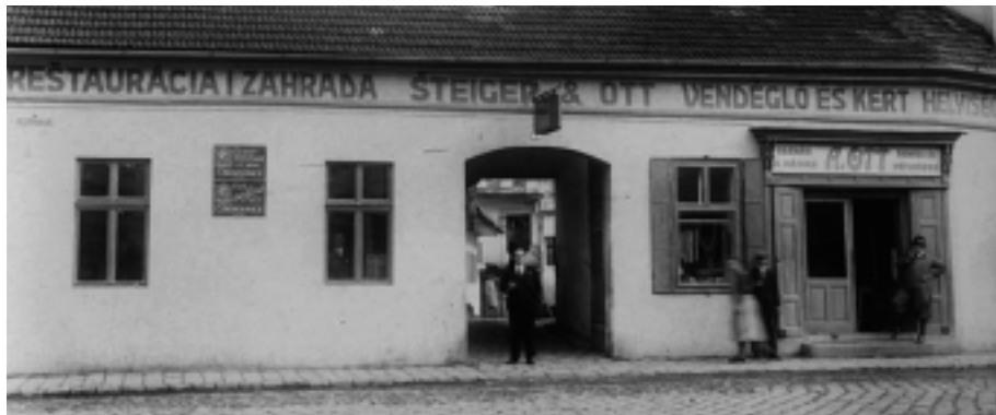
Staršia (pôvodná) budova súkromnej reštaurácie Steiger a Ott na Gusztínyiho ulici č. 1 pred demoláciou.