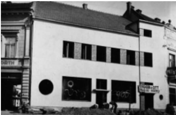
Novopostavená reštaurácia Steiger a Ott, ktorú pre verejnosť otvorili v roku 1933 krátko pred konaním Pribinových osláv.

Vyživovacie stredisko - VYŽIVOVÁK , pôvodne závodná jedáleň ROH (Revolučného odborového hnutia) Podnikového riaditeľstva Reštaurácie Nitra. Vznikla v roku 1949 znárodnením súkromnej reštaurácie Steiger a Ott na Gusztínyi-